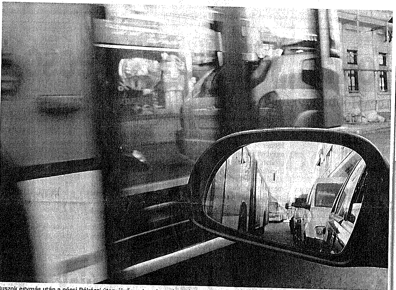
Buszok egymás után a pécsi Rákóczi úton: jövőre a tervek szerint már új rendszerben közlekedhetnének a járatok

TÜKE Alaposan átalakítanák jövő év elején a pécsi vonalhálózatot